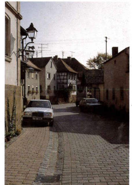
...nach der Gestaltung