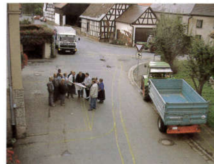
Bürgerbeteiligung bei der Planung mit „Graffiti“-Methode