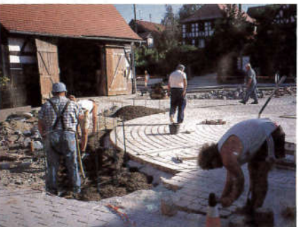
Pflasterarbeiten am Feuerwehrplatz