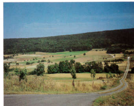
Flur bei Zeegendorf mit naturnahem Betonspurweg