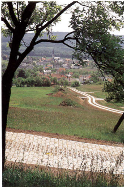
Naturnaher Wegebau in Mistendorf (Kombi- / Betonspurweg)

Im Zuge des Flurbereinungsverfahrens wird auch vom Freistaat Bayern (Straßenbauverwaltung) und vom Landkreis Bamberg Land erworben, das im Rahmen der Neuverteilung der Grundstücke in die neugeplanten Trassen der Staatsstraßen St 2188, 2210 und 2276 bzw. Kreisstraße BA 46 verlegt werden soll.