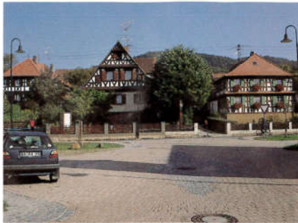
...und nach Fertigstellung