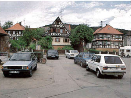
Feuerwehrplatz vor den Dorferneuerungsmaßnahmen...