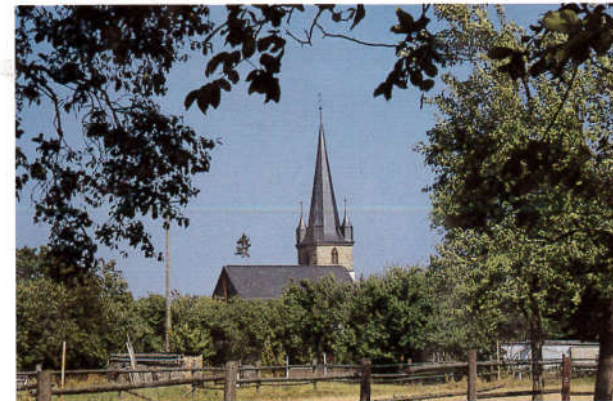
Die Kirchen der Gemeindeteile (v. l. o.) Zeegendorf, Mistendorf, Leesten, Geisfeld

Die Flurbereinigungsverfahren Geisfeld-Leesten mit 568 ha LN, Mistendorf mit 209 ha LN und Zeegendorf mit 185 ha LN gehören zur Gruppenflurbereinigung Bamberg - Ost und wurden im Februar 1979 von der Flurbereinigungsdirektion Bamberg eingeleitet. Die Neuverteilung der