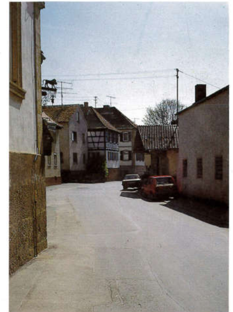
Alte Dorfstraße vor der Gestaltung